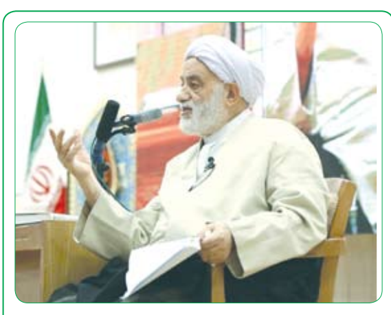
استاد قرآنی خطاب به انجمن جماعات: مصادیق قرآنی فعالیت های اجتماعی را از قرآن برای مردم بیان کنید

رئیس ستاد اقامه نماز کشور با بیان اینکه بر اساس حدیثی از امام رضا (ع) خداوند متعال نماز را واجب کرد تا قرآن از مهبوریت خارج شود، گفت: قرآن را درک کنید، سپس برای نسل جوان حرف های تازه بگویند و بدانند که قرآن سرشار از حرف های نو و تازه است و به یاد داشته باشید که مصادیق قرآنی همه فعالیت های امروز اجتماعی را می توانید از قرآن خارج کرده و برای مردم بیان کنید. حجت الاسلام والمسلمین محسن قرآنی در همایش ویژه تقدیر و تجلیل از انجمن جماعات و خادمان نماز صبح مساجد مشهد، در مجتمع آیه ها، مسجد را به عنوان جایگاه عبادت مسلمانان و از مهمترین نهادهای جامعه اسلامی دانست که در طول تاریخ نقش بنیادین ایفا کرده است، اظهار کرد: مسجد به عنوان پایگاه اصلی انقلاب نقش آفرینی کرده و امروز نیز نقش چشمگیری به عنوان کانون تحولات بیداری اسلامی در منطقه دارد. او در ادامه ضمن اشاره به برخی ویژگی ها و خصوصیه های مسجد در تراز انقلاب اسلامی تصریح کرد: بنا بر آیه ۹۶ سوره آل عمران خداوند این چنین بیان کرده که من کره زمین را که خلق کردم مسجد الحرام را برای عبادت قرار دادم؛ این بیان صریح بدین معنی است که مسجد باید محور باشد و یکی از دلایل شاخص جبهه و جنگ نیز در تاریخ حفظ معابد بوده است.